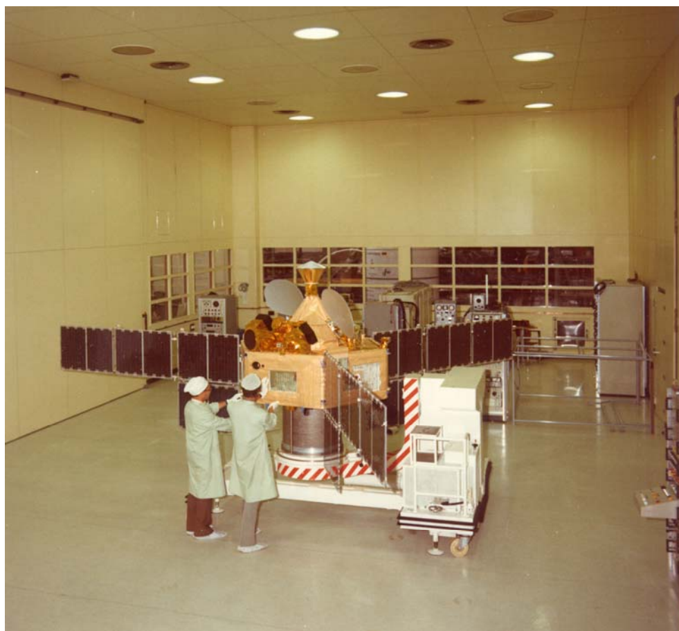
Symphonie 1 aux Mureaux